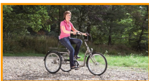
Fahrkomfort neu definiert