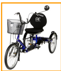
Sicheres und bequemes Fahren