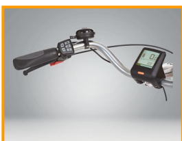
Display mit Tacho